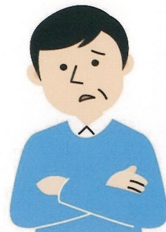
アルツハイマー病発症までの経緯