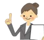
委託時研修会講師