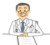
申出者の医師面接